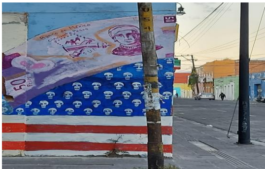
Mural de la organización Stop Trump en el Barrio de San Antonio en la ciudad de Puebla. 2020.

Profesora-Investigadora, Facultad de Ciencias Políticas y Sociales, BUAP (México) y Presidenta de la Asociación Mexicana de Estudios Internacionales (2023-2025)